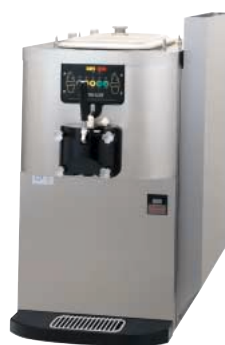
オプションの排気シュート装着時

ホッパー内の温度が表示されるので、製品の温度を衛生上安全に保つことができます。摂氏・華氏どちらでも温度を表示できます。