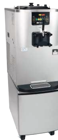
オプションのドア付きカート装着時

Rockton, Illinois 61072 800-255-0626 Phone 815-624-8333 Fax 815-624-8000 www.taylor-company.com e-mail: info@taylor-company.com