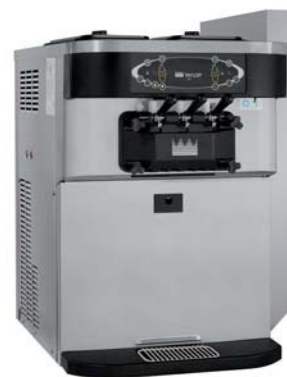
オプションの排気シュート装着時。

スタンバイモード 長時間製品を販売しない場合はスタンバイ機能により、ホッパーと冷却シリンダー内のミックスを衛生上安全な温度に保ちます。