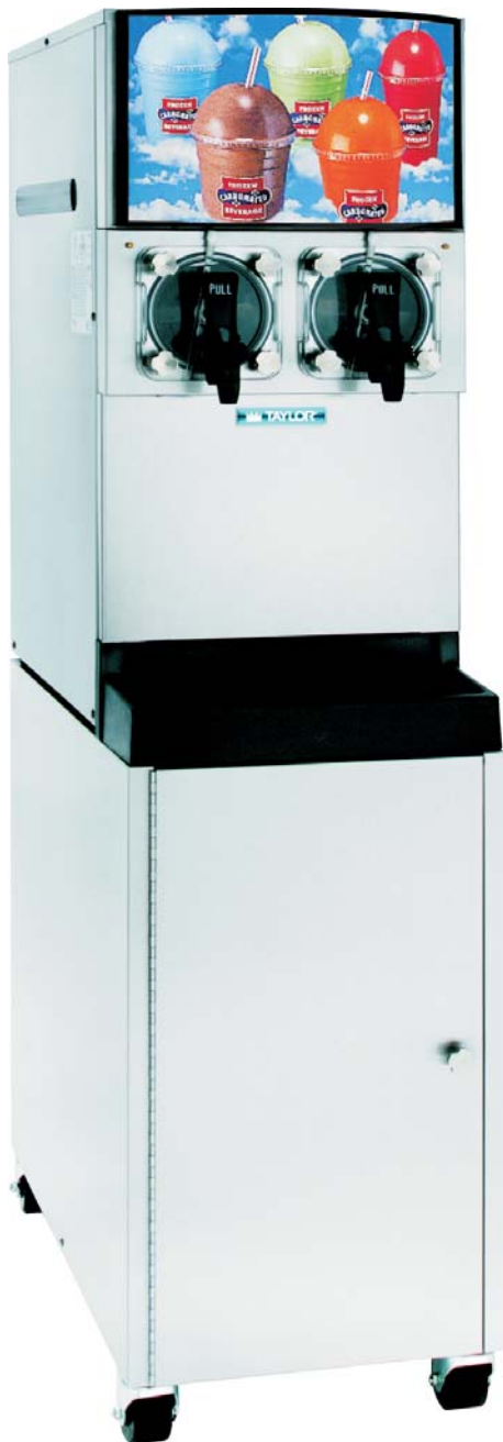
オプションのシロップカート付き

バックライトの明るいディスプレイと透明なフリーザードアは顧客の関心を引きつけます。