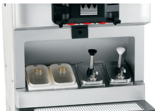
シロップレール-室温保管用2個 (カバー、レードル付) ヒーター、トッピングポンプ付2個