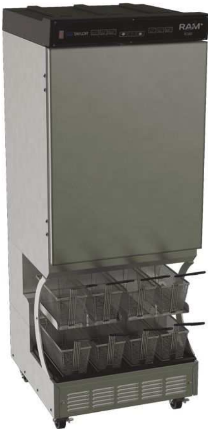
Fryer Baskets Sold Separately